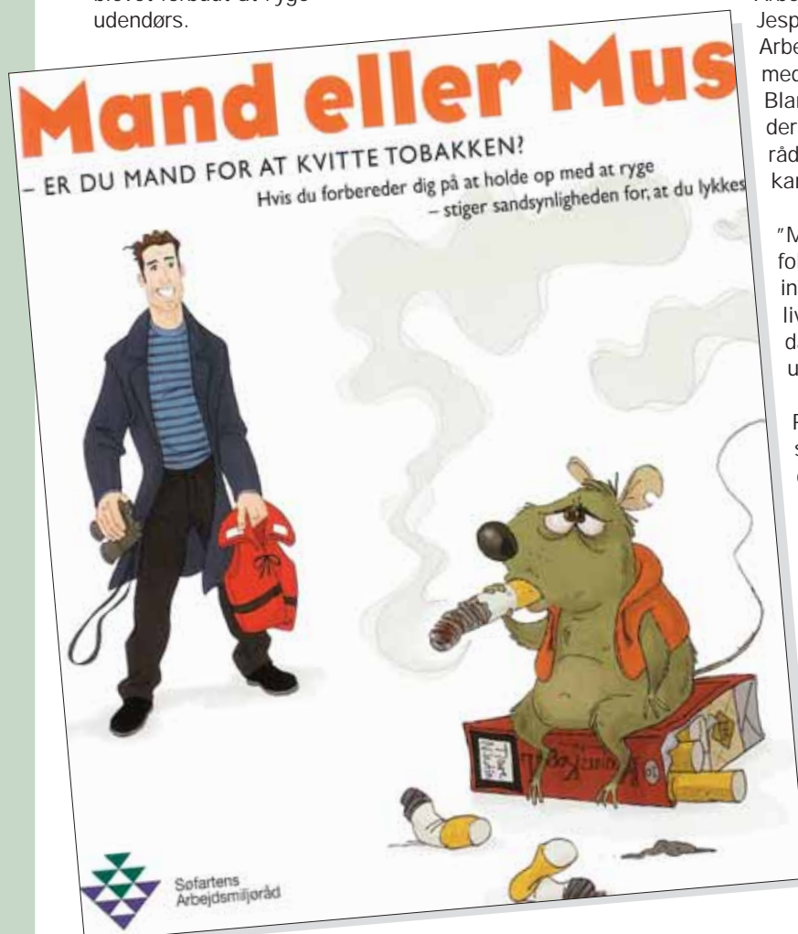
Er du Mand eller Mus – en ny pjece fra Søfartens Arbejdsmiljøråd giver gode råd om at kvitte tobakken.

Sejler du i langfart, sker rådgivningen via nettet eller telefonisk. Den begynder med en afklarende samtale om dine motiver og ønsker til at kvitte tobakken. Den samtale følges op af yderligere tre kontakter med rygestoprådgiveren pr. telefon