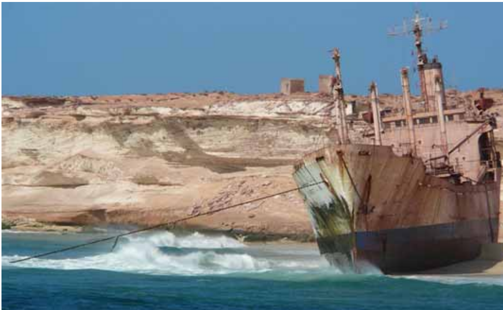
Var det en menneskelig fejl?

Psykolog har udviklet metode til at dykke ned i begrebet menneskelige fejl