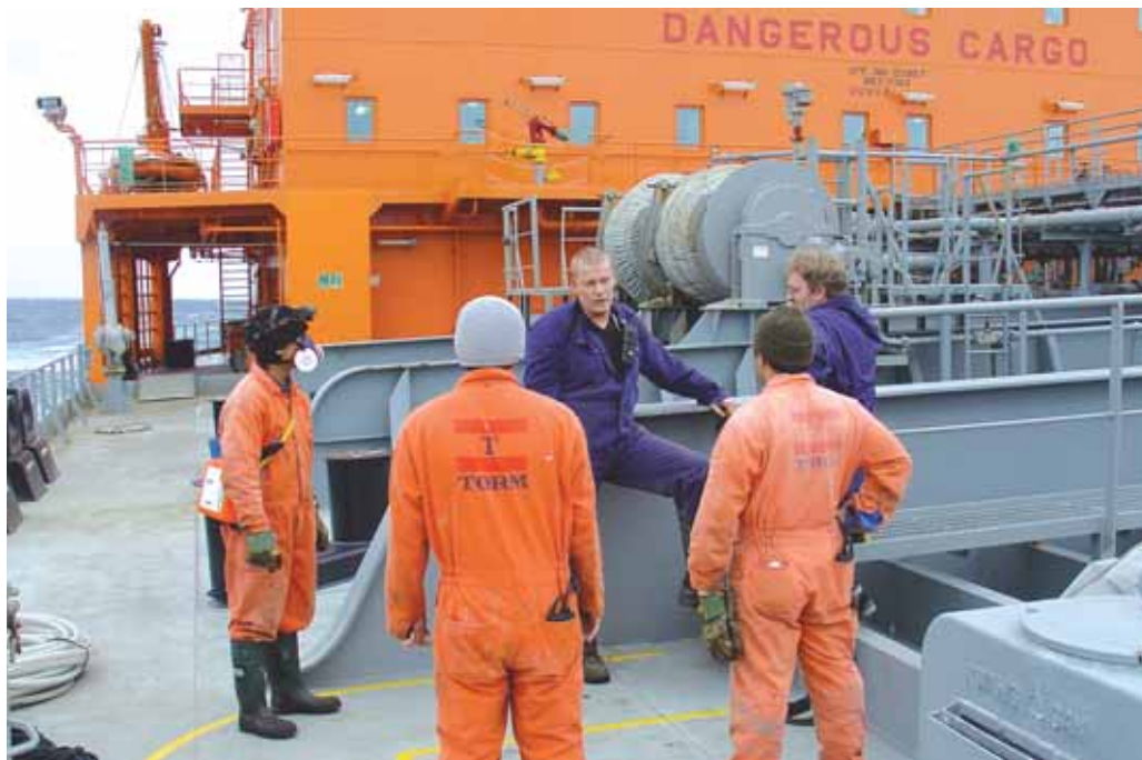
Ledelse er den afgørende faktor for at opnå en god forretning, og ledelse handler om at få mennesker til at fungere i et godt samspil. Ellers risikerer man, at der bliver truffet forkerte beslutninger. Arkivfoto.

“What characterizes a good day aboard a ship?” “If you can identify it, you can talk about it and then you are on the way to putting good management in place.”