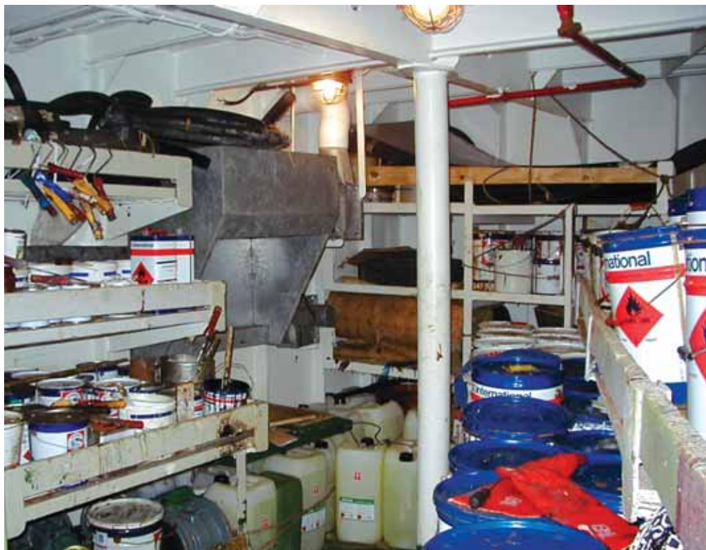
Det er vigtigt at indberette nye kemikalier – eller nye navne på "gamle" kemikalier, så databasen til stadighed kan være opdateret. Arkivfoto.

As a registered user of the database, you can access the Danish Maritime Occupational Health Service website to submit information on chemicals at www.seahealth.dk