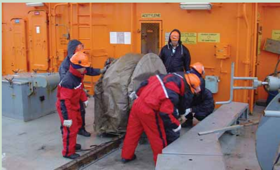
En god sikkerhedskultur skaber et godt arbejdsmiljø og et godt samarbejde, og hermed er grundlaget for færre ulykker skabt.