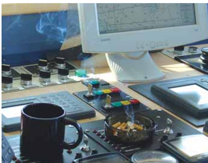
Rygeloven administreres lempeligt frem til årsskiftet, men herefter er der kun kaffen tilbage. Arkivfoto.

Har I udarbejdet en rygepolitik, må I meget gerne sende den til Rådet. Alle rygepolitikker indgår i vidensbanken i anonymiseret form. Rygepolitikker, samt spørgsmål og ønsker om Rådets bistand kan sendes til info@seahealth.dk