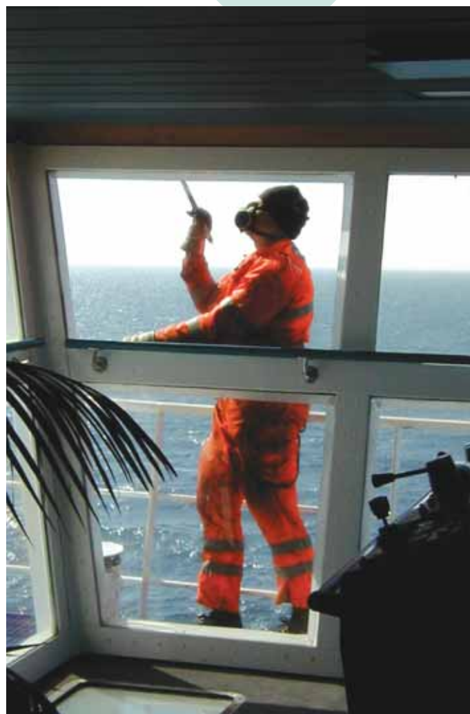
Det opdaterede program gør det nemmere at holde styr på kemikalierne og se, hvad der skal bruges af personlige værnemidler. Arkivfoto.

– Det er en fordel både for den enkelte sømands sikkerhed og sundhed, men også for at opfylde lovgivningens krav om