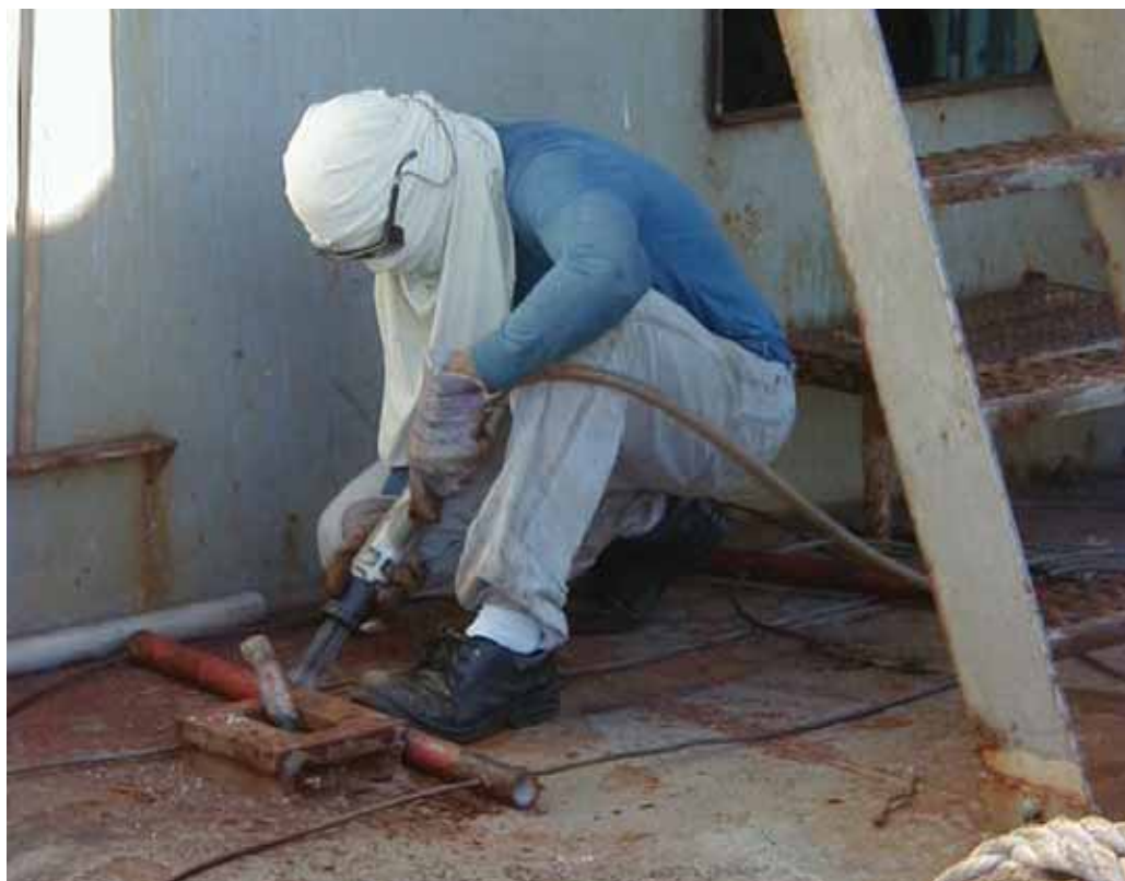
Der er mange risikable arbejdsprocesser på et skib. Ved hjælp af indberetninger om near miss kan I være med til at gøre dem mindre risikable. Arkivfoto.

Det går langsomt fremad, men der er barrierer, som sk